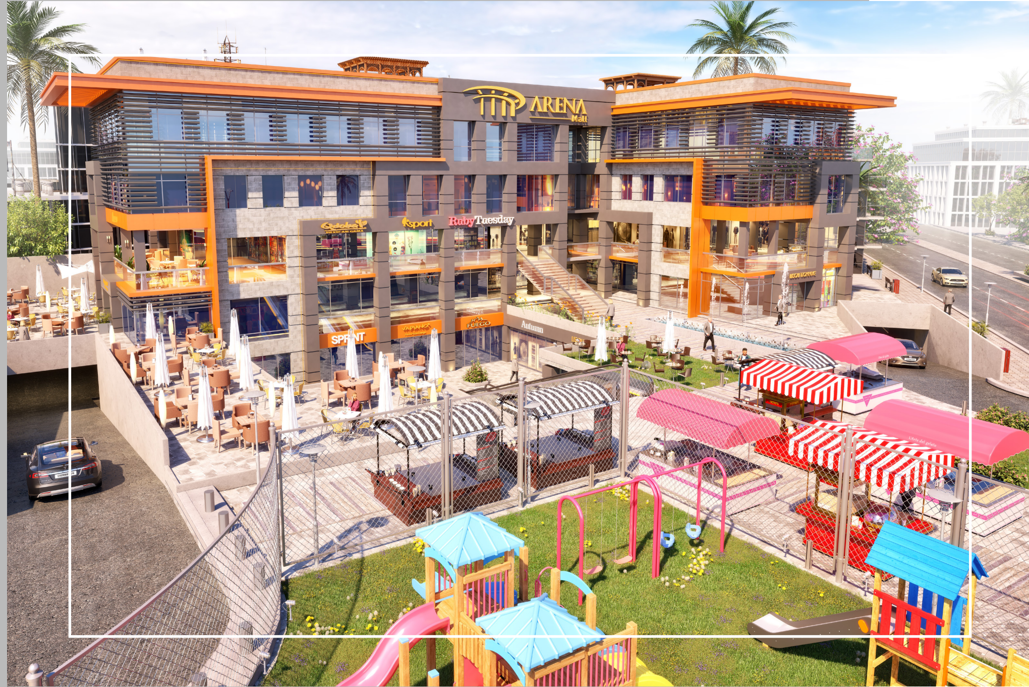
El Shorouk City