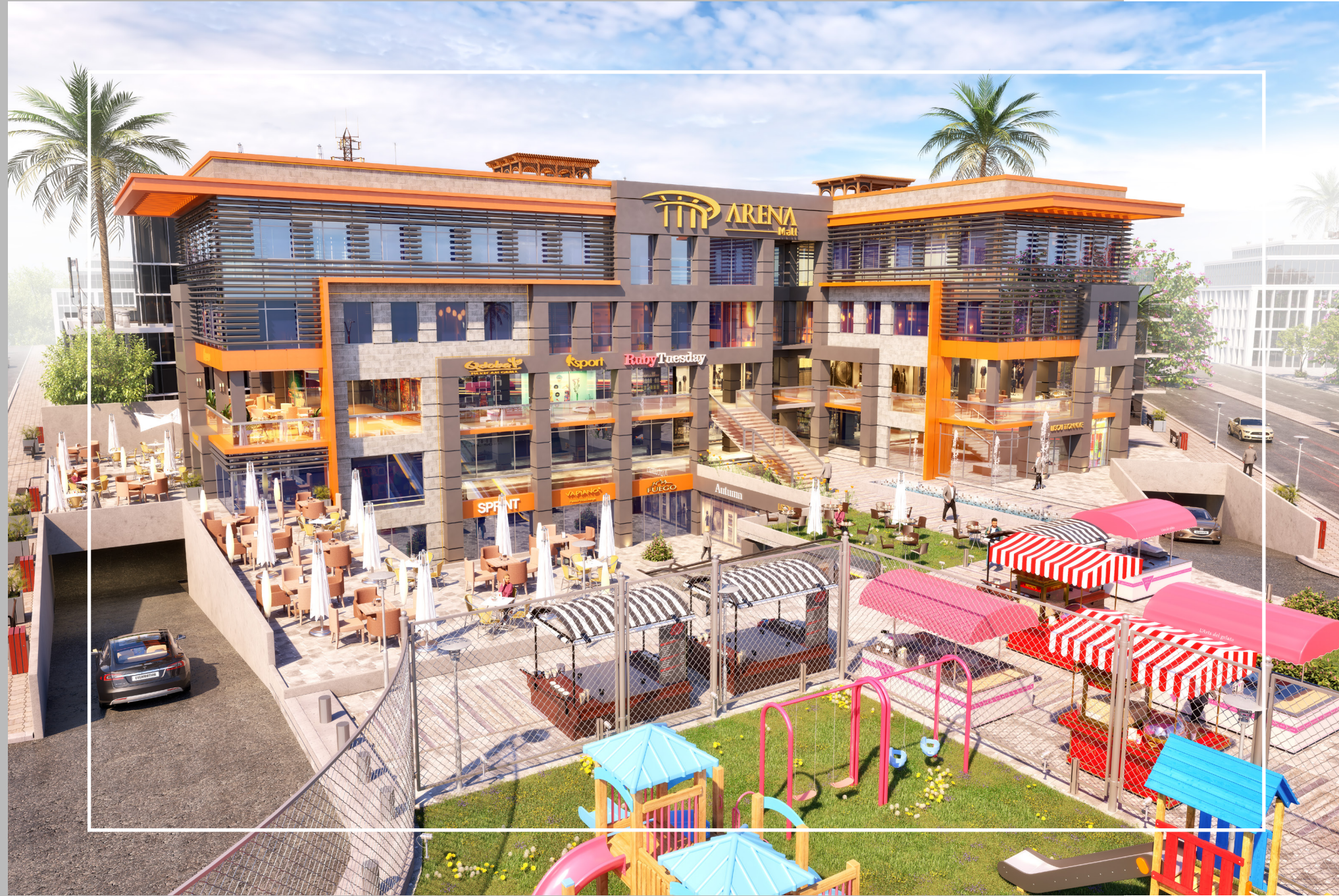
El Shorouk City