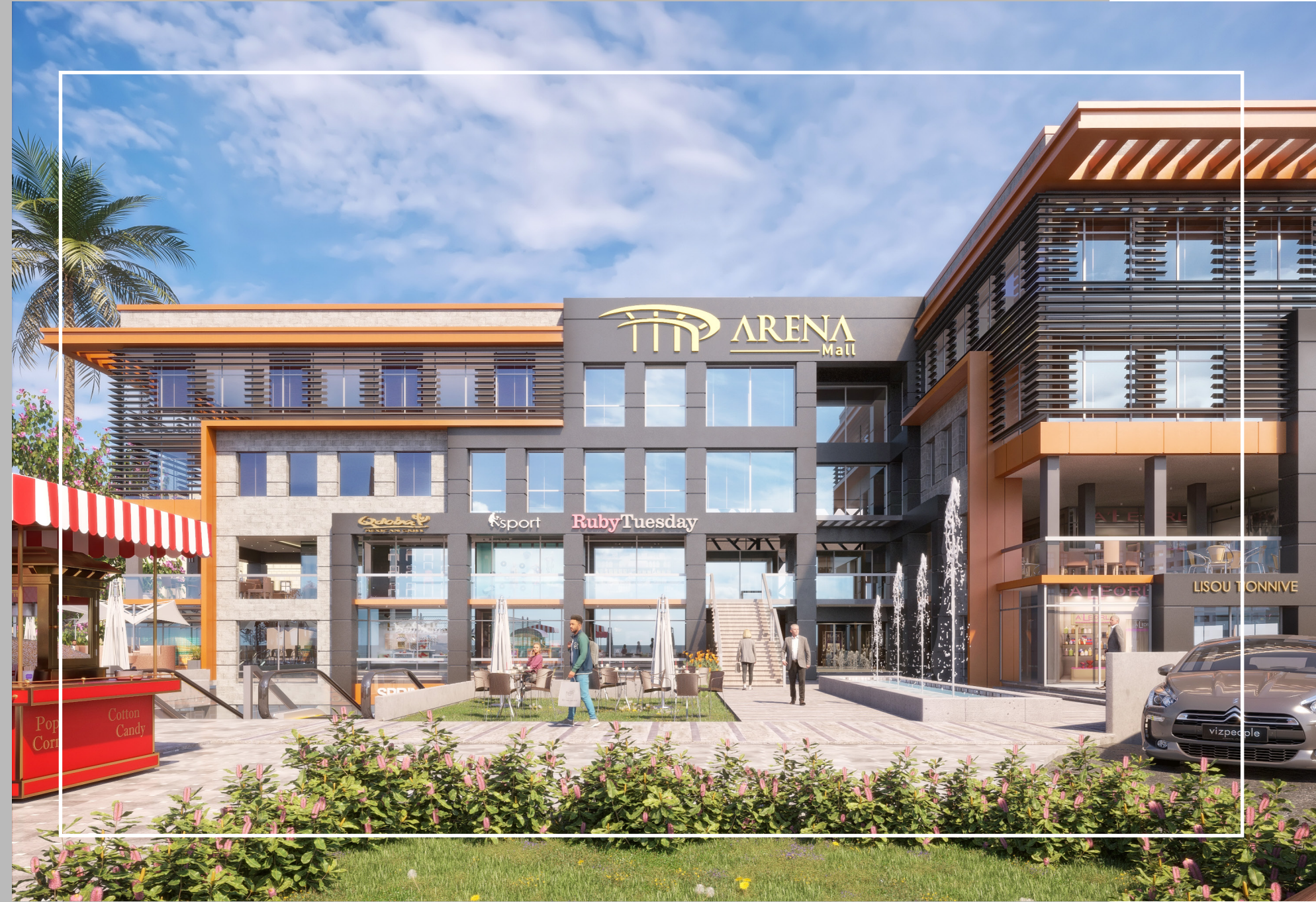
El Shorouk City